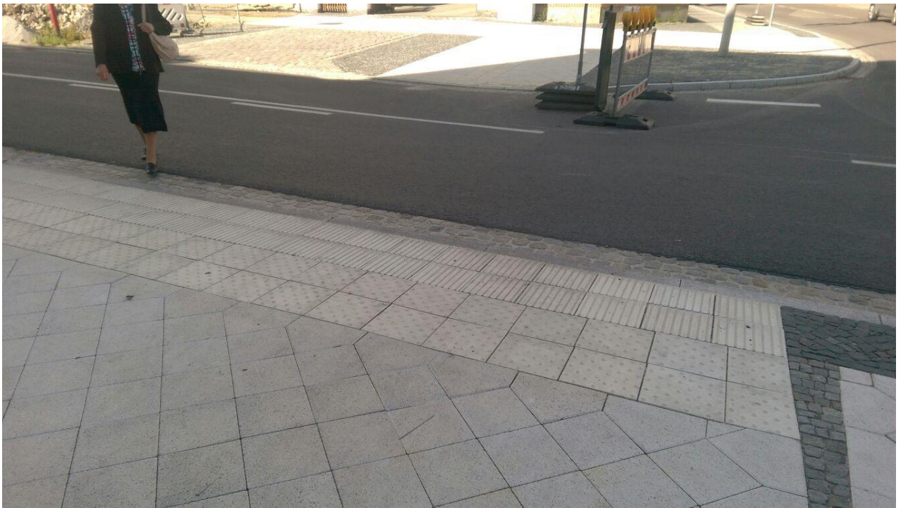
Foto: verlegtes Leitsystem an der Querung Breithaus/Drebkauer Straße