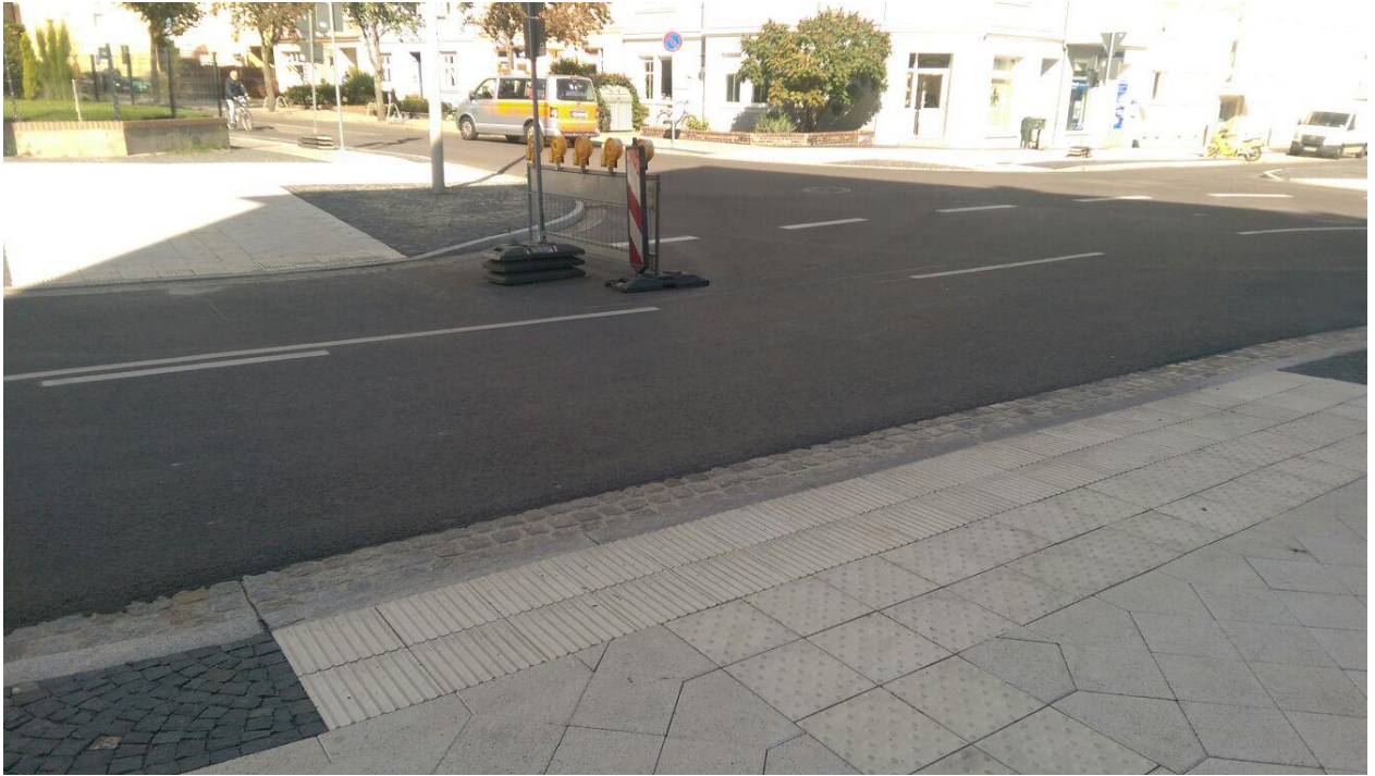
Foto: verlegtes Leitsystem an der Querung Breithaus/Drebkauer Straße